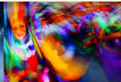
Wolfgang Elster · Freies Thema